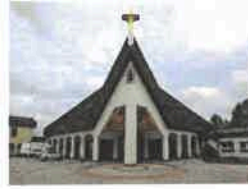
Leinefelde/Südstadt St. Bonifatius