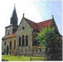
Kallmerode St. Martin