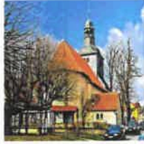
Breitenholz Mariä Heimsuchung