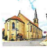
Beuren St. Pankratius