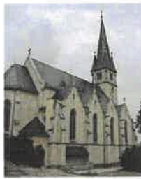
Lfd. St. Maria Magdalena Pfarrkirche