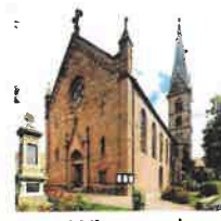
Wingerode St. Johannes d. Täufer