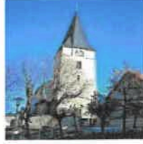
Breitenbach St. Margaretha