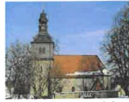
Lfd. St. Maria Magdalena Alte Kirche