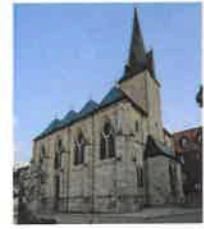
Birkungen St. Johannes d. Täufer