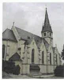
Lfd. St. Maria Magdalena Pfarrkirche