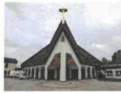
Leinefelde/Südstadt St. Bonifatius