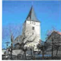
Breitenbach St. Margaretha