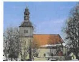
Lfd. St. Maria Magdalena Alte Kirche