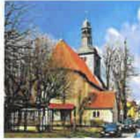
Breitenholz St. Mariä Heimsuchung