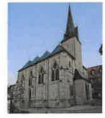
Birkungen St. Johannes d. Täufer