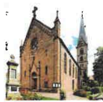
Wingerode St. Johannes d. Täufer