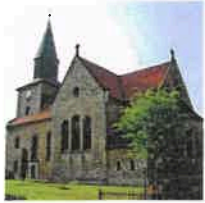
Kallmerode St. Martin