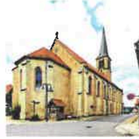
Beuren St. Pankratius