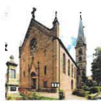
Wingerode St. Johannes d. Täufer