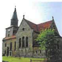
Kallmerode St. Martin