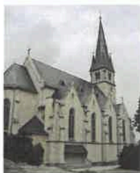
Lfd. St. Maria Magdalena Pfarrkirche