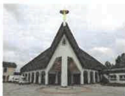
Leinefelde/Südstadt St. Bonifatius