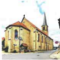
Beuren St. Pankratius