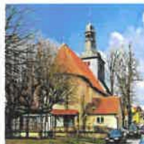
Breitenholz St. Mariä Heimsuchung