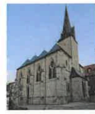
Birkungen St. Johannes d. Täufer