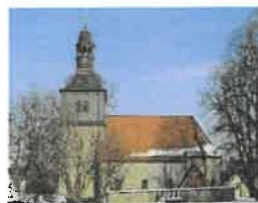
Lfd. St. Maria Magdalena Alte Kirche