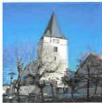
Breitenbach St. Margaretha